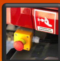
PARADAS DE EMERGENCIA